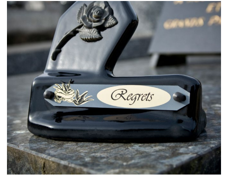
Grabado de placas y artículos funerarios