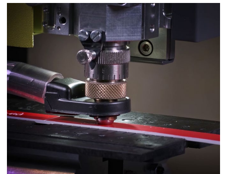
Placas de identificación y pequeña rotulación